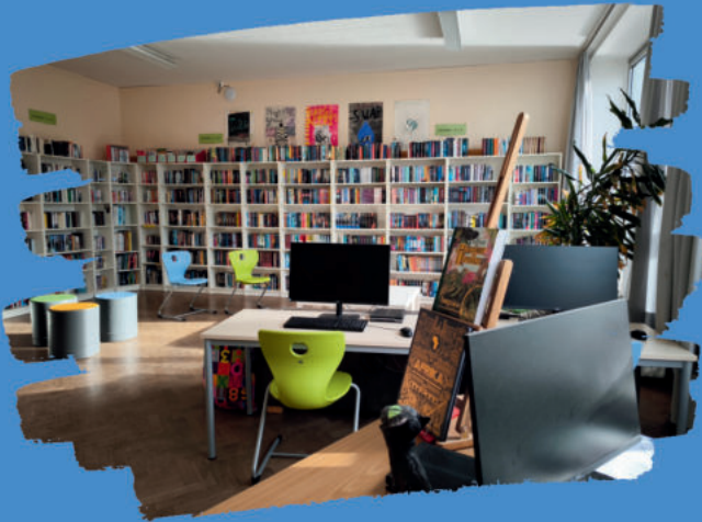
Beispiel Schulbibliothek: Der Förderverein unterstützt bei Neuanschaffungen und Arbeitsplatzausstattungen.